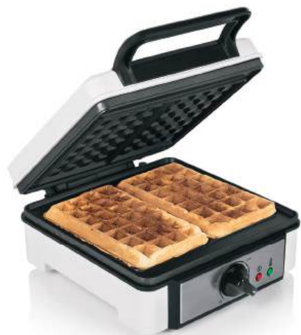
Waffle iron 01.132397.01.001

PARTS DESCRIPTION / ONDERDELENBESCHRIJVING / DESCRIPTION DES PIÈCES / TEILEBESCHREIBUNG / DESCRIPCIÓN DE LAS PIEZAS / DESCRIÇÃO DOS COMPONENTES / DESCRIZIONE DELLE PARTI / BESKRIVNING AV DELAR / OPIS CZĘŚCI / POPIS SOUČÁSTÍ / POPIS SUČASTÍ / ОПИСАНИЕ ЗАПЧАСТИ