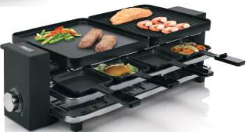
Raclette Piano Black 4 / Raclette Piano Black 8 01.162915.01.001 / 01.162925.01.001

PARTS DESCRIPTION / ONDERDELENBESCHRIJVING / DESCRIPTION DES PIÉCES / TELEBESCHREIBUNG / DESCRIPCIÓN DE LAS PIEZAS / DESCRIÇÃO DOS COMPONENTES / DESCRIZIONE DELLE PARTI / BESKRIVNING AV DELAR / OPIS CZĘŚCI / POPIS SOUČÁSTÍ / POPIS SOUČASTI