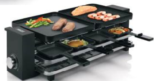
Raclette Piano Black 4 / Raclette Piano Black 8 01.162915.01.001 / 01.162925.01.001

PARTS DESCRIPTION / ONDERDELENBESCHRIJVING / DESCRIPTION DES PIÈCES / TELEBESCHREIBUNG / DESCRIPCIÓN DE LAS PIEZAS / DESCRIÇÃO DOS COMPONENTES / DESCRIZIONE DELLE PARTI / BESKRIVNING AV DELAR / OPIS CZĘŚCI / POPIS SOUČÁSTI / POPIS SUČASTI