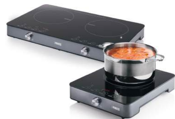
Princess Induction Plate 01.303010.01.001 / 01.303011.01.001

PARTS DESCRIPTION / ONDERDELENBESCHRIJVING / DESCRIPTION DES PIÈCES / TEILEBESCHREIBUNG / DESCRIPCIÓN DE LAS PIEZAS / DESCRIÇÃO DOS COMPONENTES / DESCRIZIONE DELLE PARTI / BESKRIVNING AV DELAR / OPIS CZĘŚCI / POPIS SOUČÁSTÍ / POPIS SUČASTÍ / ОПИСАНИЕ ЗАПЧАСТИ